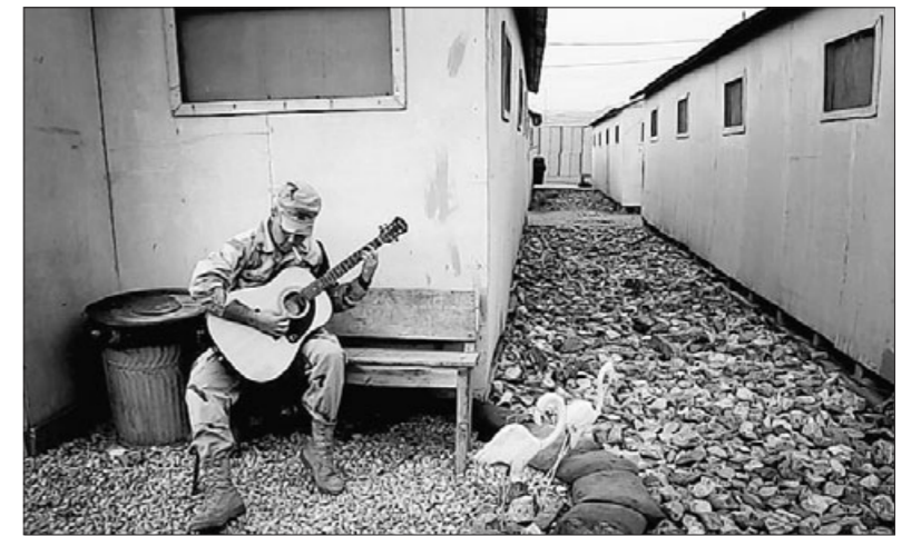
Trotz Gitarrenspiels ist der US-Stützpunkt Bagram in Afghanistan, wo derzeit ein Deutscher einsitzt, alles andere als ein Idyll.

Steinmeier hat sich inzwischen persönlich des Falls angenommen und seine US-Kollegin Condoleezza Rice darauf angesprochen. Angeblich verlangen die USA eine umfassende Sicherheitsgarantie. Dies würde aber eine pausenlose Überwachung des Mannes erfordern – was eine praktisch nicht erfüllbare Bedingung ist.