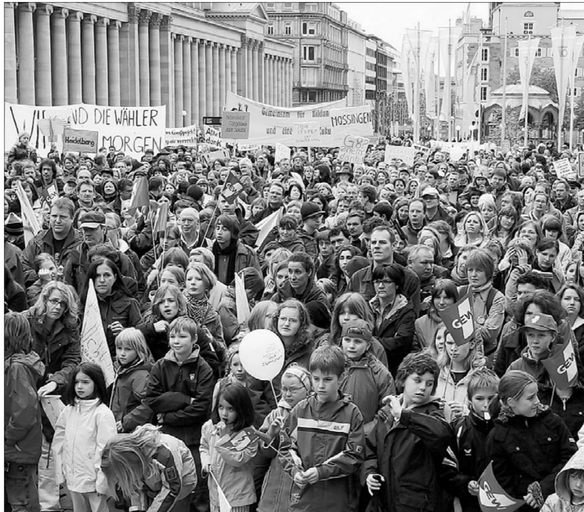
Protest auf dem Stuttgarter Schlossplatz: Schüler sollen besser gefördert werden.

Es sind viele, viele Kritikpunkte an der Schule, die nun die laut Veranstalterangaben rund 5000 Demo-Teilnehmer auf den Schlossplatz gegenüber des silbergrauen Kunstmuseum-Würfels gebracht haben. „G 8 – nein danke“, steht auf einem Plakat, auf einem anderen heißt es: „Kinder brauchen Erfolge“. Vertreter des Enzthal-Gymnasiums aus Bad Wildbad fordern „maximal 15 Schüler pro Klasse“, eine andere Schule ist bescheidener: „Wir wollen eine Musik-AG.“ Die zehnjährige Grundschülerin Maite stellt sich auf den aufgeklappten Lkw, der als Bühne